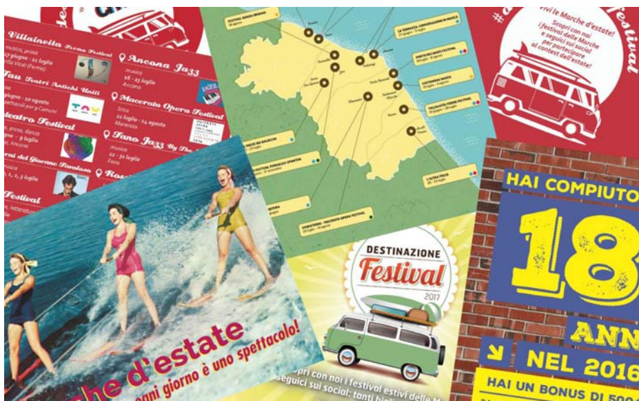
Nell’immagine, un collage con alcuni dei materiali promozionali prodotti in occasione delle campagne di comunicazione del CMS.

In coordinamento e raccordo con la Regione Marche, si sono sfruttate varie occasioni per la comunicazione e la promozione del sistema dello spettacolo marchigiano. Il Consorzio ha infatti partecipato all’edizione 2016 della BIT - Borsa Internazionale del Turismo di Milano, in cui è stato possibile dare ampia visibilità ai materiali promozionali degli enti Consorziati e raccontare la vivacità del comparto spettacolo dal vivo regionale, e al convegno Cultura come Risorsa, come Valore, organizzato dalla Regione stessa il 28.02.2014, ad Ancona.