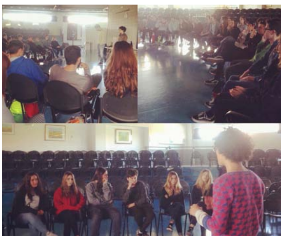
Nella foto, alcuni momenti dell'incontro tra la compagnia Aldes e gli studenti di Civitanova Marche (a cura di AMAT)

Anche per quanto riguarda l'attuazione di una delle principali novità del nuovo Decreto regolante i contributi del FUS, le "residenze" (art. 45), il Consorzio ha svolto un'importante funzione essendo previsto che la gestione avvenga in base ad accordi tra il Ministero e le Regioni, ed avendo la Regione Marche affidato il compito al Consorzio di guidarne gli sviluppi (forte anche della positiva esperienza del progetto "Teatri del Tempo Presente", basato sul medesimo assetto istituzionale e descritto nel precedente report triennale di attività). "Residenze" è un progetto interregionale triennale (2015-2017), di sostegno alle residenze di spettacolo dal vivo che mira a contribuire all'insediamento,